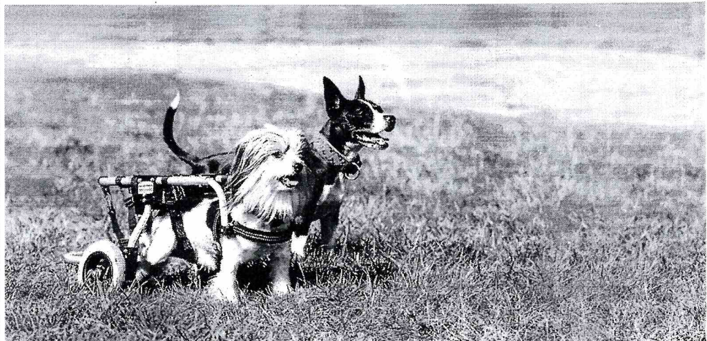
Ob Beine oder Räder, Hauptsache es geht vorwärts: Gelähmte Hunde begrüßen Rollwagen, mit deren Hilfe sie sogar wieder rennen können.