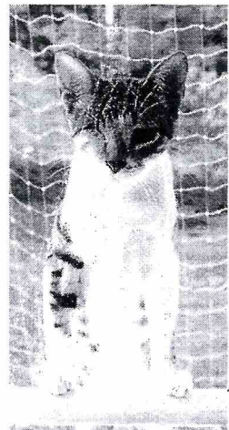
Zwei Katzen: Die einäugige Lillifee (links) und der zweibeinige Leroy (rechts) klettern sogar auf Bäume, trotz Handicap.

Unter www.tierisch-anders.ch findet man Tipps und Hilfsmittel für die Haltung behinderter Tiere. Die Firma Rehatechnik für Kleintiere fertigt Rollwagen auf Mass. www.orthopaedietechnik-tiere.ch